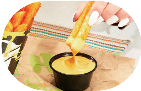
타코벨이 최근 전국에 출시한 신메뉴 Plant-based 나초소스