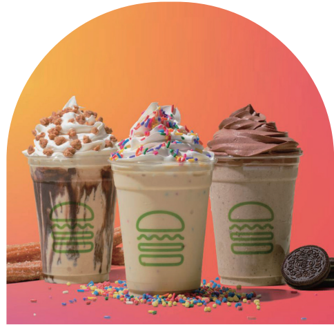
올해 초 웨이크셰이크 뉴욕에서 시범 출시한 Plant-based 웨이크