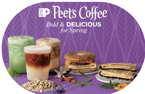
피츠커피가 올해 봄 선보인 Plant-based 메뉴

보고서에 따르면 최근 몇 달간 식물성 제품의 매출 성장세가 둔화되고 있는 가운데 레스토랑과 식품 서비스 시설의 매출 호조가 눈에 띄었다. 보고서는 레스토랑과 식품 서비스 시설은 식물성 제품 기반 회사가 공략할 수 있는 좋은 장소라고 분석하였다. 식물성 육류 대체품 구매자는 연간 약 30회 더 식품 서비스 시설을 방문하고 평균 구매자 보다 약 400달러 더 많은 비용을 지출하는 것으로 조사되었다.